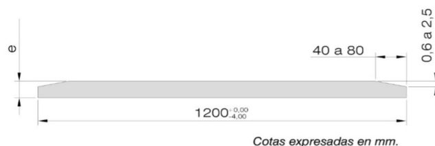
Cotas expressadas em mm.

Consultar o Manual do Instalador Placo®.